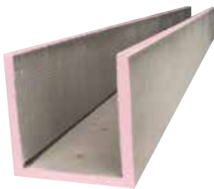
Austrotherm Uniplatňa U - profil